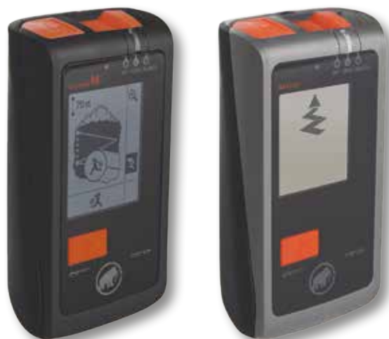
NUOVO ARTVA MAMMUT BARRYVOX S